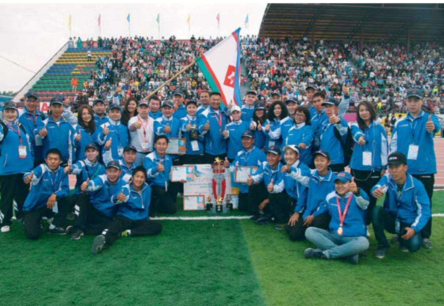
Сборная команда Якутска – победитель XIX Спартакиады национальных видов спорта «Игры Манчаары». ▲

становится весьма популярным. Когда к нам приходят с целью привлечь молодежь к спорту, к здоровому образу жизни, стараемся помочь, чем можем, хотя бы кубками, медалями, советами.