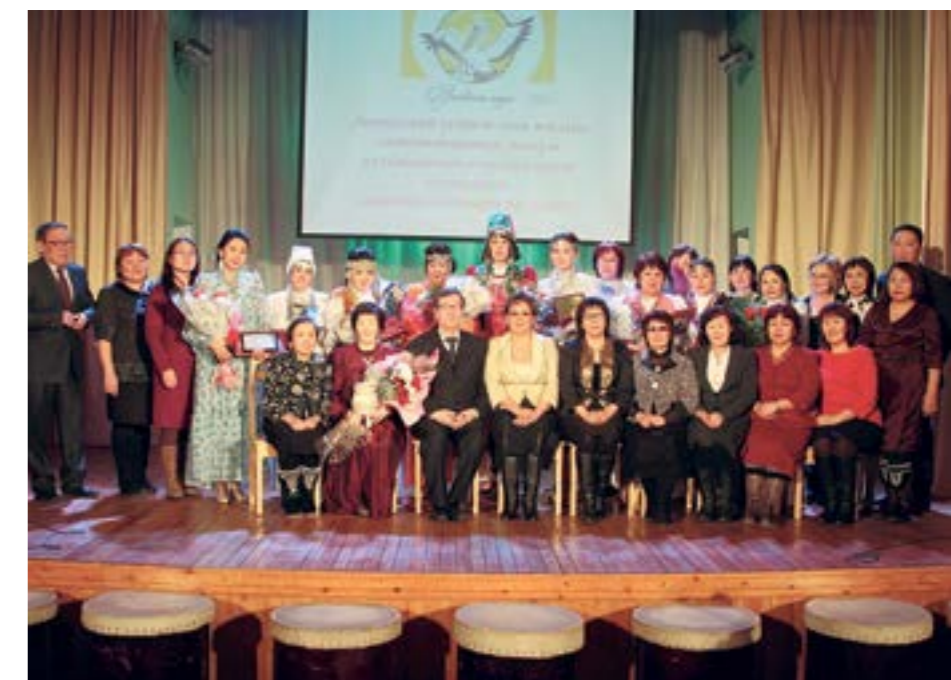
Участники городского конкурса учителей родного языка и национальной культуры

В Якутске практически каждая школа обеспечивает детей возможностью говорить на родном якутском языке.