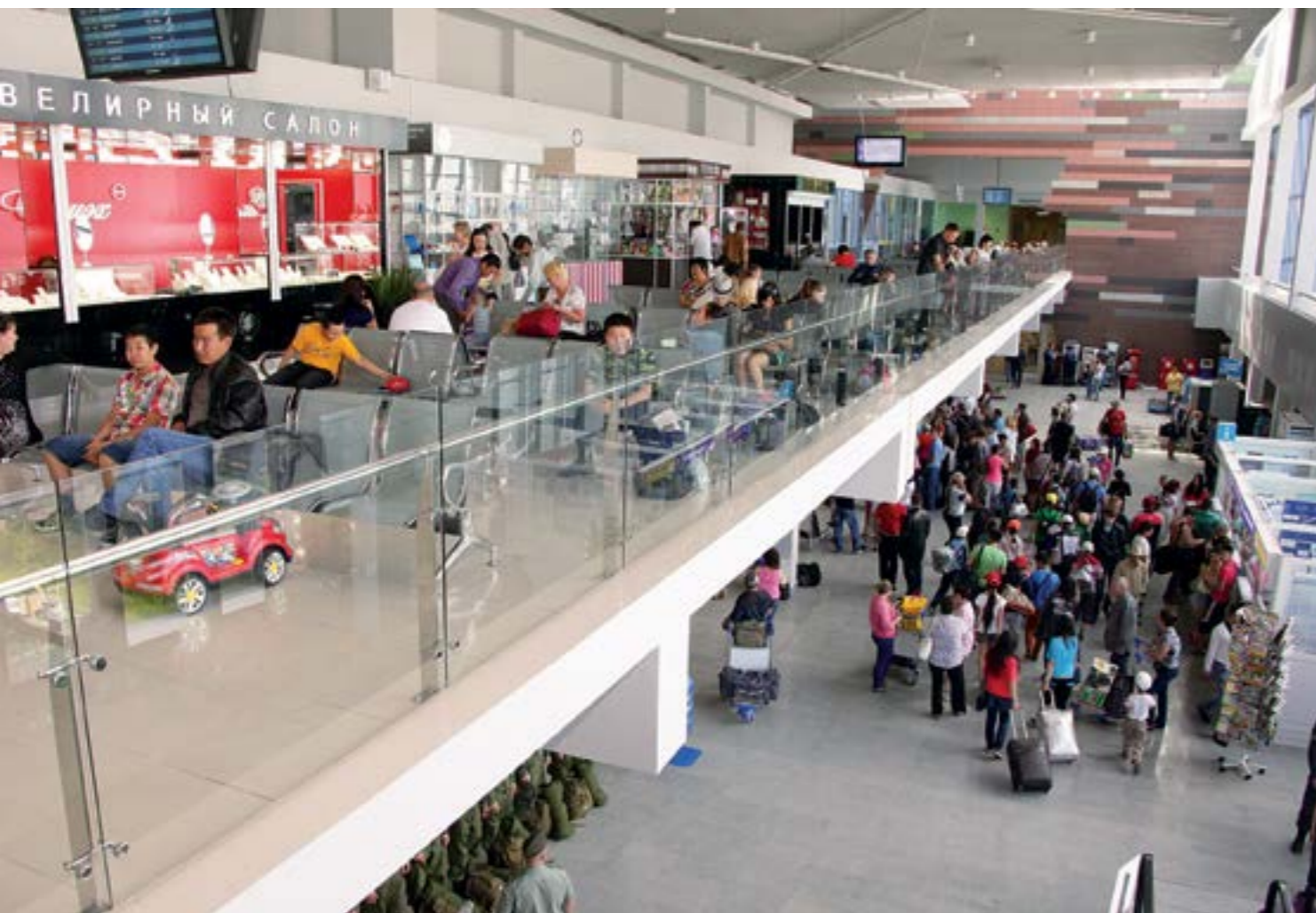
В аэропорту города Якутска