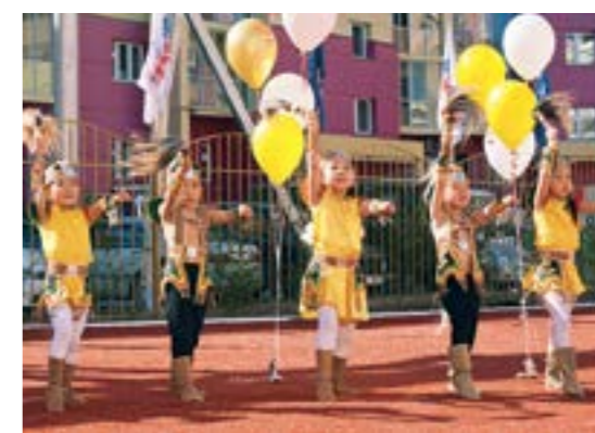
Маленькие горожане – воспитанники детских садов