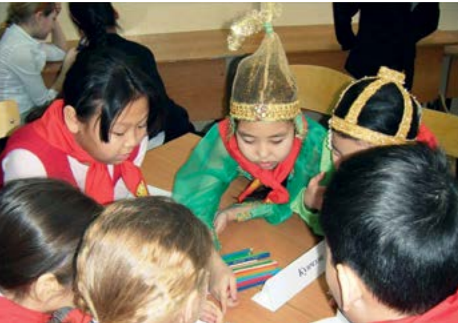
Творчество – основа воспитания

В 50 школах столицы обучается 34721 школьник. В текущем учебном году в 25 школах ведется изучение якутского языка и литературы как предмета. И в 20 школах города на родном якутском языке обучается 7472 ученика.