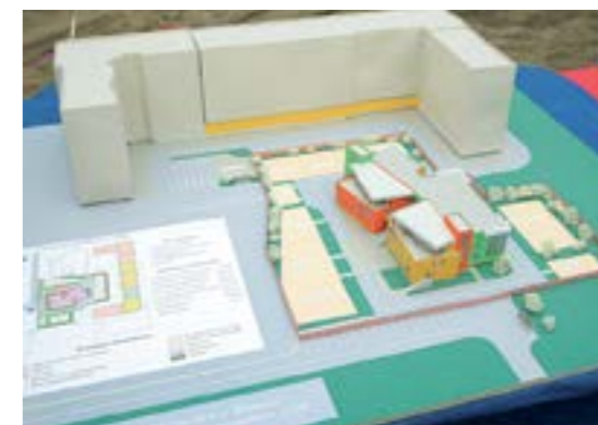
Макеты будущих детских садов