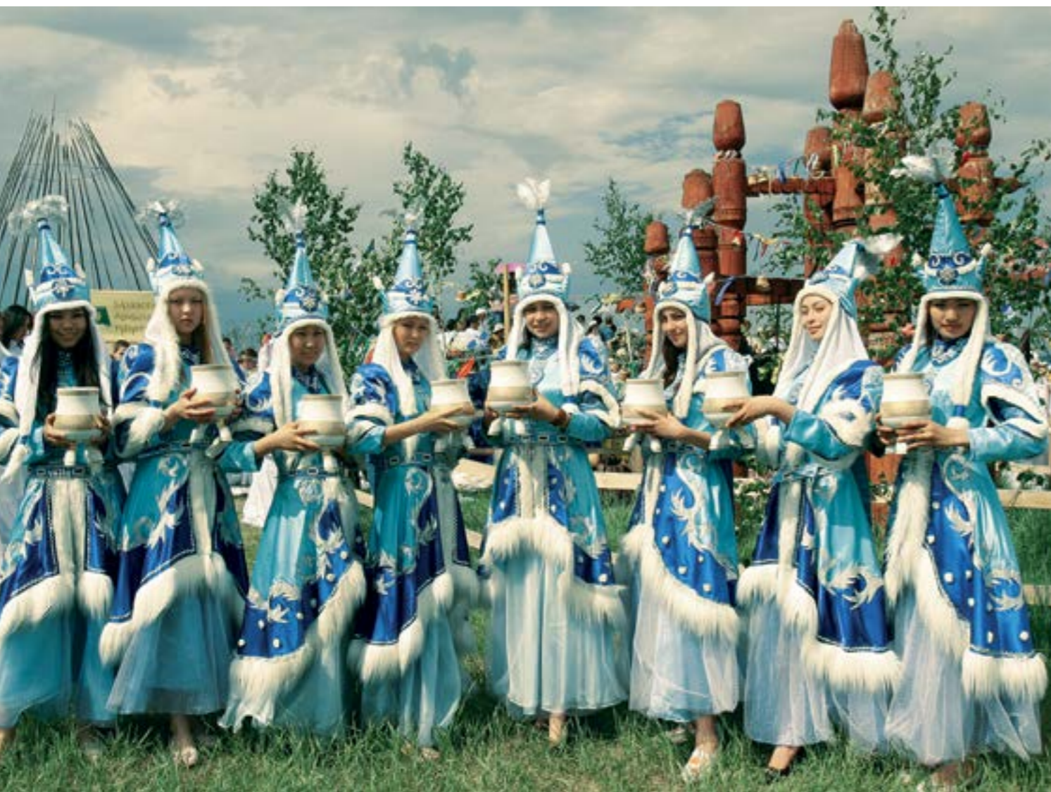
Гостей Ысыаха Туймаады встречают пенным кумысом ▲