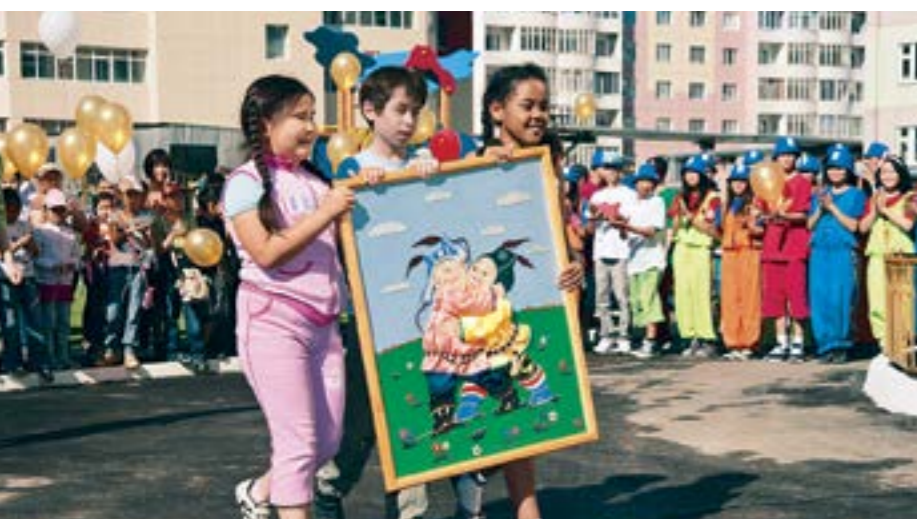
Юные артисты поздравляют своих воспитателей с профессиональным праздником

полного охвата детей дошкольным образованием.