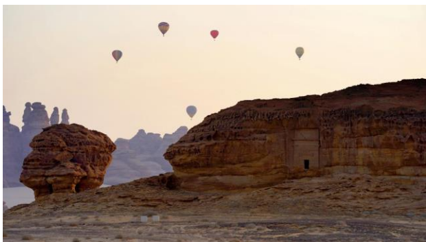
Фестиваль «Зима на Танторе».

Благодаря своему географическому положению Саудовская Аравия обладает мощным потенциалом для развития пляжного отдыха — королевство имеет самую протяженную береговую линию на Красном море. С противоположной стороны страна омывается водами Персидского залива. В рамках проекта Vision 2030 запланировано строительство нового центра пляжного туризма на берегу Красного моря. Площадь мегакурорта превысит 34 тыс. кв. км. Дресс-код для отдыхающих планируют сделать таким же, как и на большинстве популярных курортов.