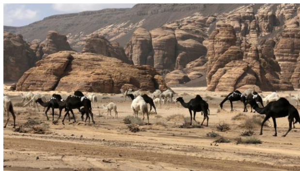
Верблюды в административном округе Аль-Ула

«Мы рассчитываем, что программа развития региона поможет создать более 2500 рабочих мест», — отметил Аль-Мадани.