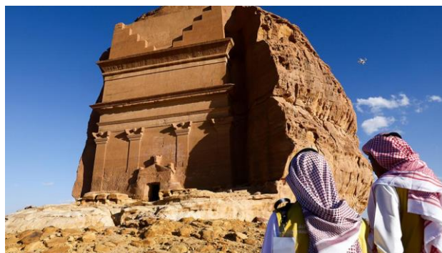
Замок-гробница Каср Аль-Фарид.

«Королевство, как вы знаете, было закрыто для туризма. Сейчас оно открывает возможности, в том числе для нас, — отметил глава РФПИ. — Саудовская сторона очень заинтересована в том, чтобы в страну приезжали российские туристы. Сегодня 6 млн туристов приезжают в Турцию, в среднем 3 млн приезжают в Египет, мы хотим, чтобы всё больше приезжало сюда».