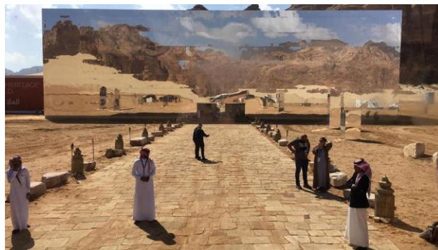
Зеркальная стена концертного зала «Аль-Марайя»

Помимо музыкальной программы гости фестиваля смогли попробовать аутентичную кухню региона, а после заката отправиться на экскурсию по наблюдению за звездным небом в сопровождении астрономов. С конца января по 9 февраля в Аль-Уле проходил Фестиваль воздушных шаров. А 2 февраля состоялись конные скачки, в которых приняли участие более 200 всадников.