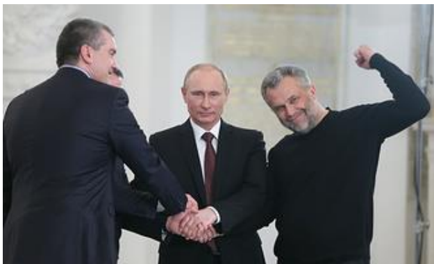
Алексей Чальй (справа) на подписании договора о принятии Крыма и Севастополя в состав РФ, 2014 год

— Безусловно, были и ошибки. Но я вам должен вот что сказать. Во-первых, я бы разделял некоторые вещи. Возврат Севастополя в Россию — это событие, которое измеряется линейкой, имеющей масштаб столетий.