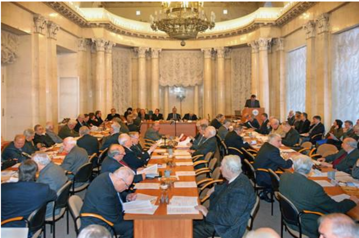
Заседание президиума РАН