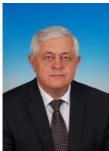
Качкаев Павел Юрьевич, заместитель председателя комитета ГД по жилищной политике и жилищно-коммунальному хозяйству

Сфера ЖКХ стала самой социально значимой в стране и во многих случаях служит «разменной монетой» в решении многих политических вопросов. Но без реформирования ЖКХ мы не сможем повысить престиж государства среди населения. Работа руководства страны и ГД ФС РФ в решении насущных проблем жилищно-коммунального хозяйства в рамках реформирования направлена на улучшение состояния жилого фонда РФ, повышение качества предоставления коммунальных услуг, эффективность обслуживания и создания условий для комфортного проживания граждан.