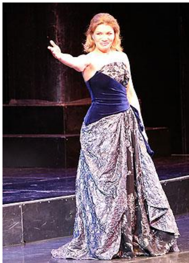
Заслуженная артистка России Екатерина Облезова