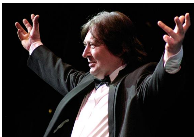
Заслуженный артист России Вадим Заплечный