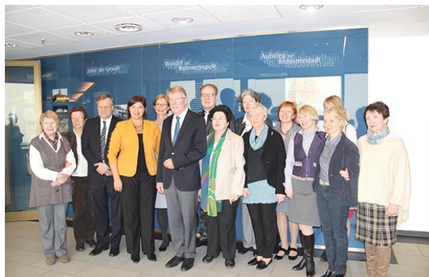
Делегация Нижнего Новгорода в немецком Эссене

Безусловно, нижегородская делегация выезжает и по личному приглашению руководства данных городов.