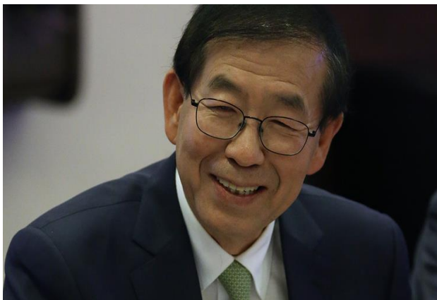
Пак Вон Сун

Мэр Сеула Пак Вон Сун во время визита в Россию посетил ТАСС, где представил инновационную цифровую систему управления мегаполисом. В эксклюзивном интервью ТАСС он рассказал о том, что общего увидел между столицей Южной Кореи и Москвой и какие направления сотрудничества между двумя странами он считает перспективными. По мнению мэра, городским властям Москвы и Сеула есть чему учиться друг у друга.