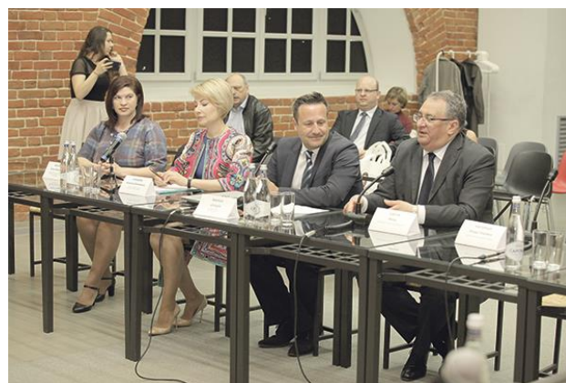
Дни Венгрии в Нижнем Новгороде прошли уже в пятый раз

Мэр Дьёра, к слову, олимпийский чемпион. Ежегодно с момента установления побратимских связей наши юные спортсмены принимают участие в ежегодном спортивном фестивале в этом городе, который проходит под патронажем мэра.