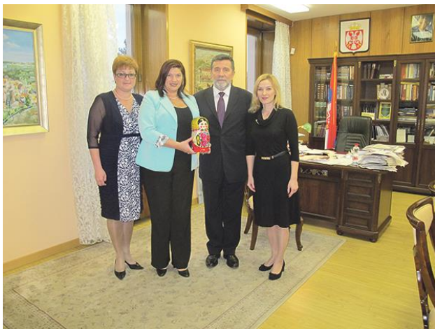
Презентация Нижнего в посольстве Сербии в России

Сейчас мы включаем в проект наши университеты и культурные организации с предложениями о формах сотрудничества с Ираклионом. Стало доброй традицией в День Нижнего Новгорода заключать новые соглашения о сотрудничестве. В этом году подписали такое соглашение с болгарским городом Добричем. Возможно, в 2018 году на очереди Ираклион.