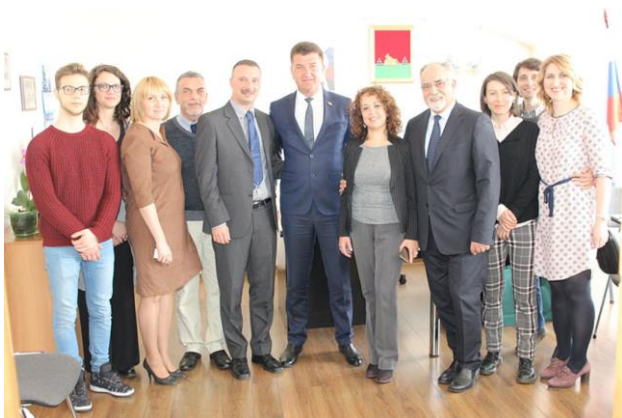
Глава города Александр Хлиманков встретился с делегацией из итальянского Турина.

Богатич - центр сербской общины, которая входит в Мачванский округ. Расположен в северо-западном уголке Сербии в устье рек Дрина и Сава. Территория богата плодородными землями. Является стратегическим транспортным узлом в связи с приграничным географическим положением. С нашими новыми побратимами так же, как и с давними друзьями, мы проводим политику открытого диалога на основе исторических, культурных, социально-экономических особенностей наших регионов. Существует длинный список тем, которые в рамках соглашений о взаимоотношении городов можно развивать до масштабных проектов. Брянск открыт для партнерских, равноправных взаимоотношений. Наш город может предложить многое в разных направлениях, что станет интересным для наших друзей.