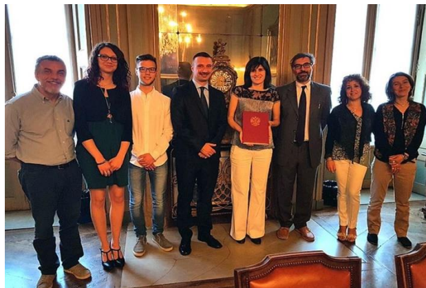
Памятный адрес Главы города Брянска был передан мэру Турина.