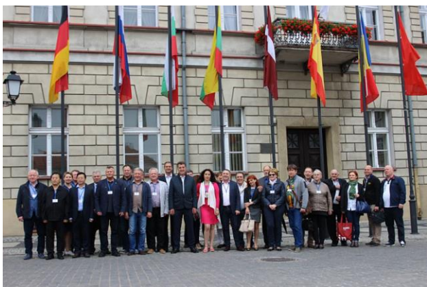
Празднование дней Конино.