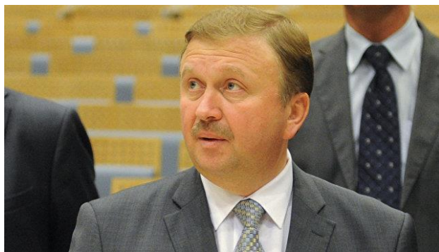
Андрей Кобяков.

«Мы договорились, мы сформировали сейчас рабочие группы, которые будут работать над соглашением о взаимном признании виз. И мы это соглашение должны подписать до конца этого года и его уже имплементировать», — передали РИА Новости заявление Кобякова каналу ОНТ.