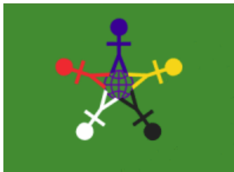
Флаг Международного дня детей.

После Второй мировой войны, когда проблемы сохранения здоровья и благополучия детей были как никогда актуальны, в 1949 году в Париже состоялся конгресс женщин, на котором прозвучала клятва о безустанной борьбе за обеспечение прочного мира, как единственной гарантии счастья детей. Через год, в 1950 году 1 июня был проведен первый Международный день защиты детей, после чего этот праздник проводится ежегодно.