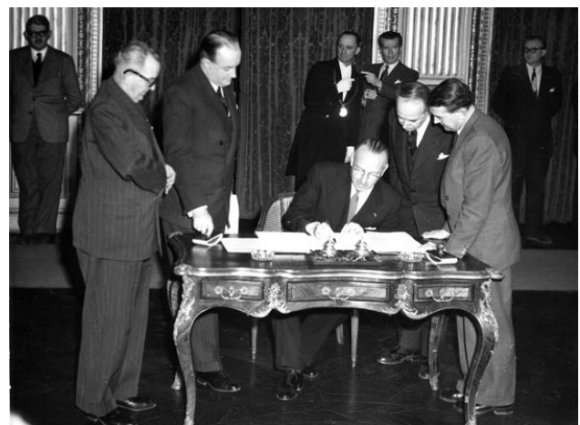
Министр иностранных дел Бельгии подписывает договор о создании ЕС.

Создание Европейского объединения угля и стали в 1951 году стало первым камнем в фундаменте европейской интеграции.