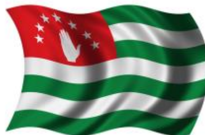
Государственный флаг Абхазии

3 июня 2005 года Президент Абхазии Сергей Багапш подписал принятый Народным Собранием — Парламентом — Закон «О внесении дополнения и изменения в Закон Республики Абхазия «О памятных и праздничных днях в Республике Абхазия»». С этого времени 23 июля объявлен Днем Государственного флага Республики Абхазия.