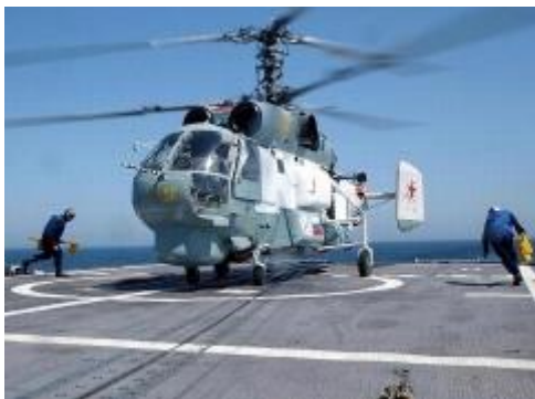
История российской морской авиации началась 17 июля 1916 года

17 июля 1916 года над Балтийским морем русские летчики одержали победу в воздушном бою в ходе Первой мировой войны. Четыре гидросамолета М-9 авианосного судна «Орлица» Балтийского флота поднялись в воздух и вступили в бой с четырьмя немецкими самолетами. Победа в этом воздушном бою положила начало истории российской морской авиации.