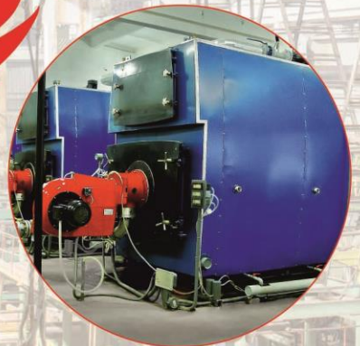
Котлы мощностью от 0,05 до 7,56МВт жаротрубные, водотрубные, туннельные, вакуумные