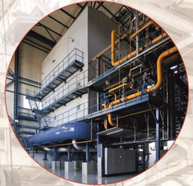
Котлы мощностью от 9,65 до 209МВт типа ПТВМ, КВ-ГМ, КВ-Р/КВ-Ф