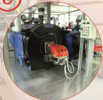
Модульные котельные МК ДКМ мощностью от 0,22 до 32МВт