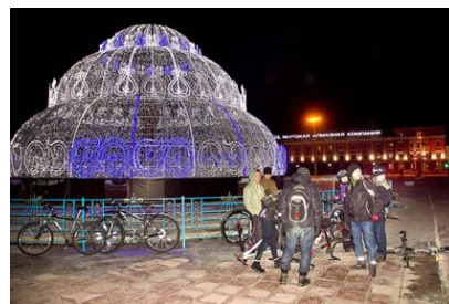
Велосипедисты Якутска

Проблемы схожие, и мы как раз обмениваемся и опытом, и рассказываем о тех проблемах, которые у нас есть. А Якутск реально самый экстремальный город мира. Нигде таких перепадов температур нет. У нас максимальная амплитуда - 106 градусов. Зимой - минус 64, летом плюс 42.