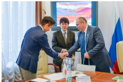
Встреча с японской делегацией

Мы будем продолжать наш город продвигать на всех площадках, чтобы мы звучали, чтобы о нас знали, чтобы к нам ехали познавать нашу замечательную территорию, для того, чтобы завлечь сюда новых специалистов на наше огромное количество инвестиционных проектов. Это задачи, которые будут стоять перед мэрией на ближайшие пять лет.