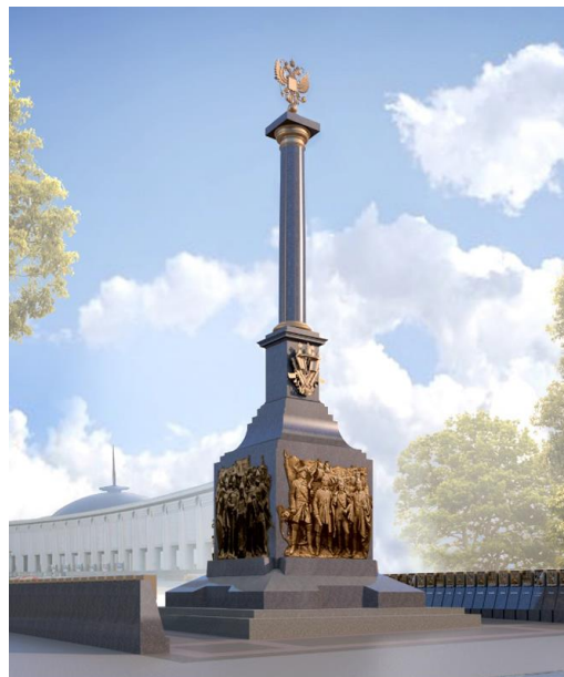
Источник – пресс-центр МАГ

«Великий полководец Георгий Жуков, 120-летие со дня рождения которого мы отмечаем 1 декабря, утверждал, что именно поражение немецко-фашистский войск под Москвой известило всему миру о крахе планов Гитлера о молниеносной войне, о начале разгрома немецко-фашистский войск», - напомнила председатель Совета Федерации Федерального Собрания РФ Валентина Матвиенко.