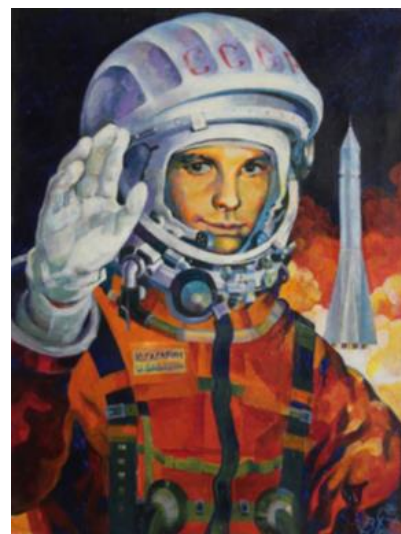
В. Н. Ржевский. Юрий Гагарин. 2011.

В своем творчестве Ржевский обращается к образам выдающихся людей России, один из них - Федор Ушаков. Легендарный русский флотоводец, командир Черноморским флотом настолько покорил его, что он создал серию картин по-священным адмиралу. Порой фантазия художника дает импульс соединить на одном полотне две реальности – современную действительность и исторический сюжет. Не менее выразителен более ранний портрет Юрия Гагарина (2013) в летном скафандре с характерным для космонавта приветственным жестом руки. История российской космонавтики особенно близка Ржевскому, и он раскрывает ее как в архитектуре (работая над проектом Музея Гагарина в Киржаче), так и в серии тематических композиций, часть из которых находится в Галерее Хань Цзяминь в Харбине и в собрании автора.