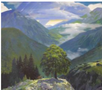
В. Н. Ржевский. Ущелье Салах Аул. 2015.