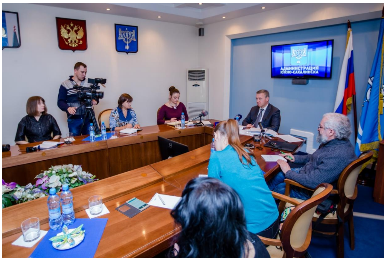
Пресс-конференция с Сергеем Надсациным.