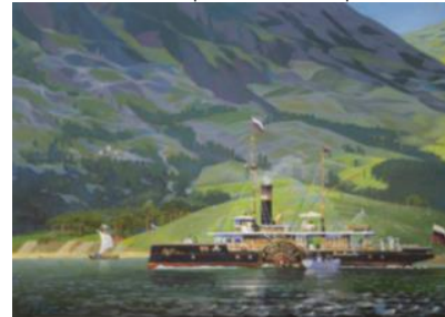
В. Н. Ржевский. Старый пароход в Которской бухте. 2014.

матушки, ее заливные просторы и эпические дали нашли свое отражение в его картинах.