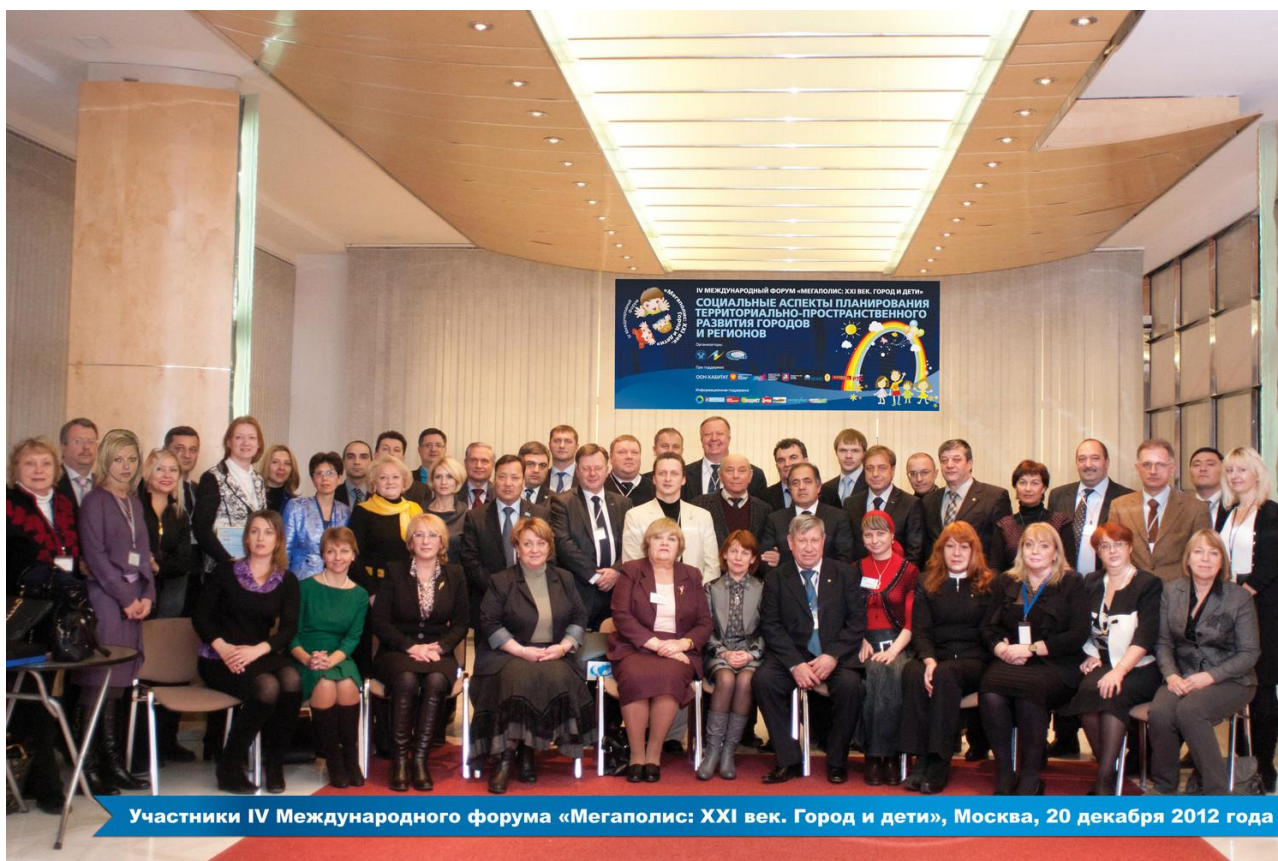
Участники IV Международного форума «Мегалополис: XXI век. Город и дети», Москва, 20 декабря 2012 года