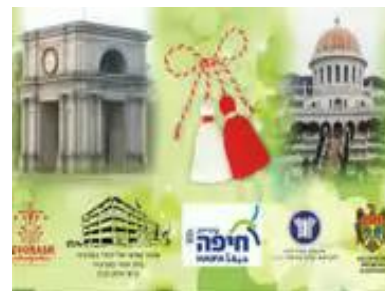
На фото фрагмент афиши празднования «Мэрцишора» в Хайфе

*По окончании беседы мы обменялись, на мой взгляд важной информацией. Я попросил Дорина Киртоакэ довести до сведения руководства Молдовы о том, что не стоит ждать туристов из Израиля по причине очень высоких цен на билеты на авиалинии Тель-Авив-Кишинёв. В свою очередь мэр Кишинёва попросил сообщить нашим читателям-выходцам из этого города, о том, что еврейская часть кладбища «Дойна» находится в крайне запущенном состоянии, и эта ситуация может быть исправлена только при поддержке родных и близких тех кто там похоронен.