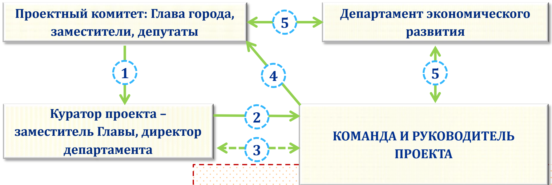
СХЕМА ПРОЕКТНОГО УПРАВЛЕНИЯ